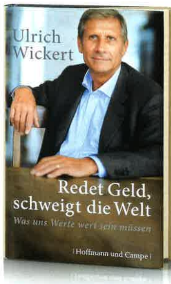
Ulrich Wickert: Redet Geld, schweigt die Welt Hoffmann und Campe, 208 Seiten, 19,99 €